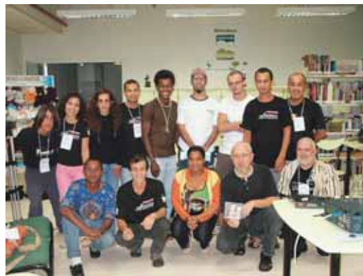
O 1º Seminário de Iluminação Cênica de Ipatinga foi realizado na Biblioteca Central de Idéias, no Centro Cultural Usiminas (MG).