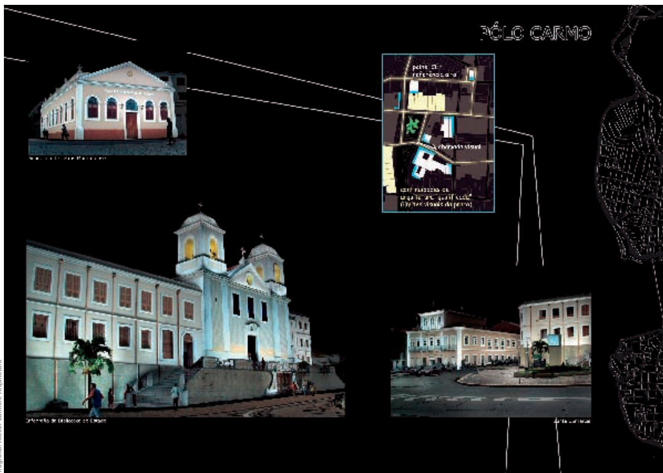
Infografia: Atelier Lumière Architecture