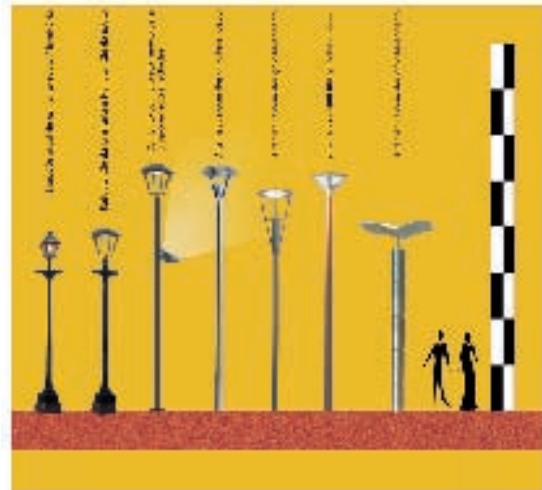
Infografia - Atelier Lumière Architecture

O Plano propõe a reformulação radical dos postes e luminárias do Centro Histórico, buscando qualidade no design e eficiência luminosa.